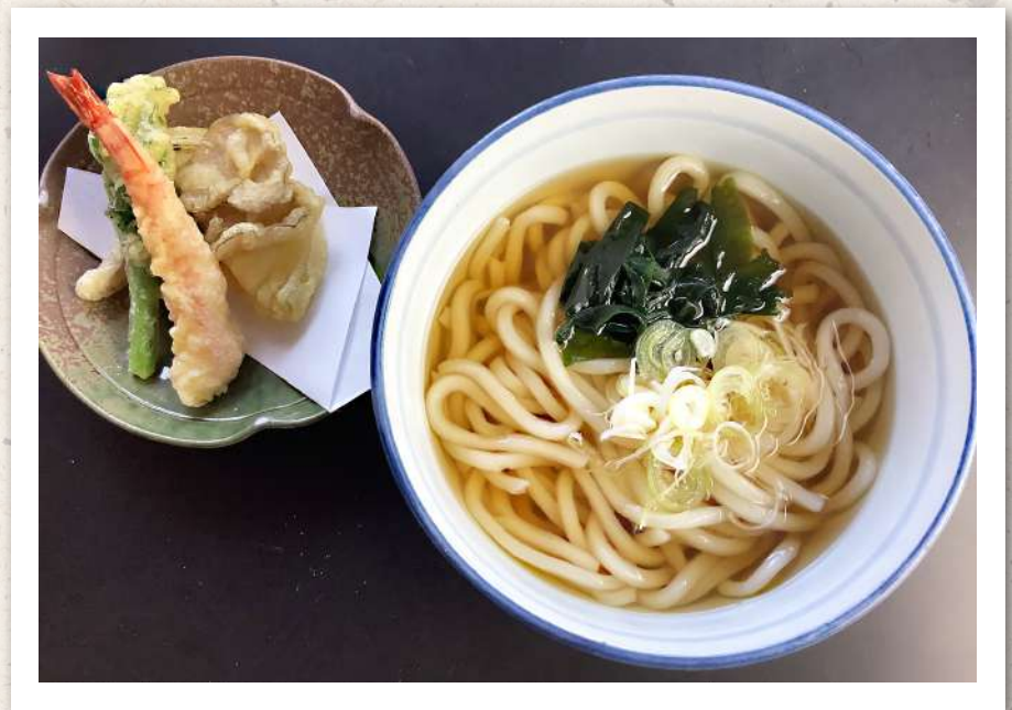
天婦羅かけうどんセット ¥1,650-