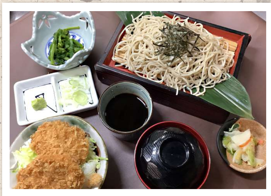
味噌ヒレカツ丼ざる蕎麦セット ¥2,300-