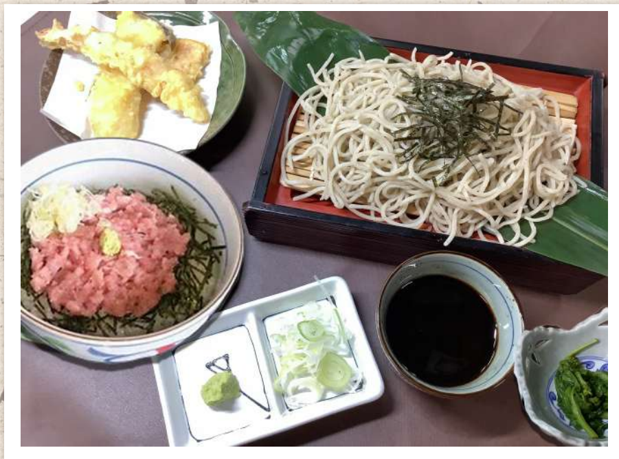
ねぎとろ丼天婦羅ざる蕎麦セット ¥2,200-