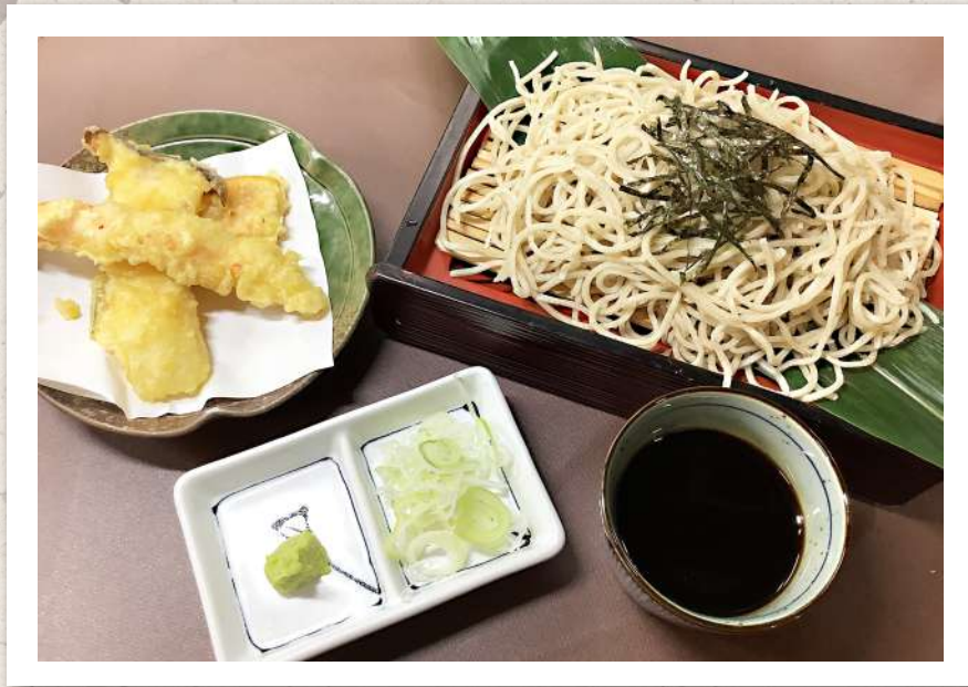
天婦羅ざる蕎麦セット ¥1,750-