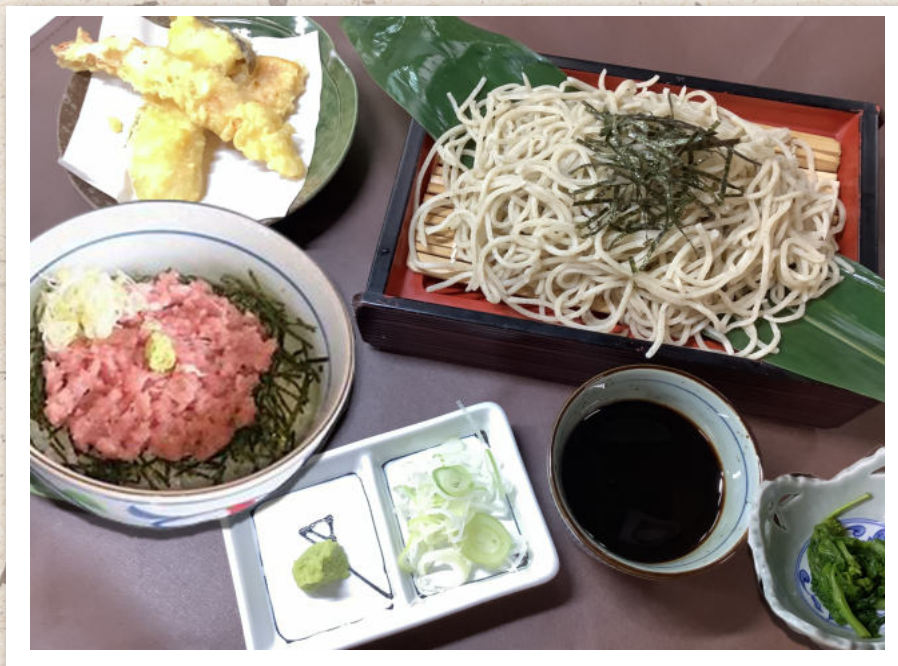
ねぎとろ井天婦羅ざる蕎麦セット ¥2,200-