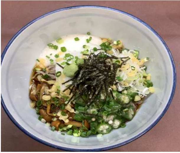
冷やしとろろそば ¥1,680-