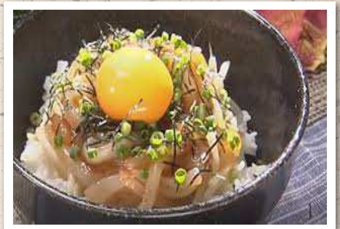
スルメイカの漁師丼 ¥1,680-