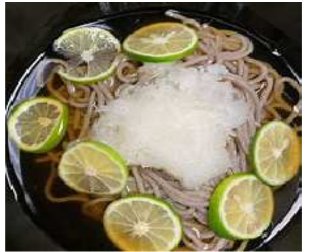
すだちおろしそば ¥1,530-