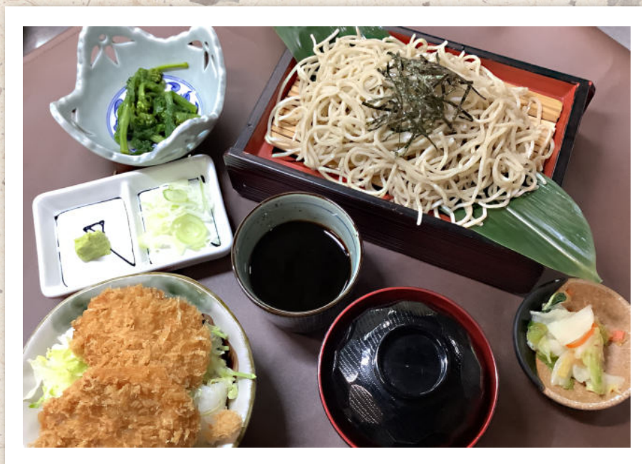
味噌ヒレカツ丼ざる蕎麦セット ¥2,300-