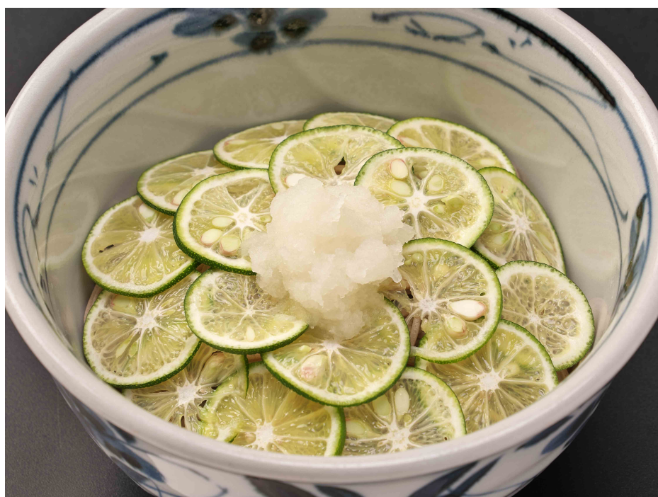
すだちおろしそば